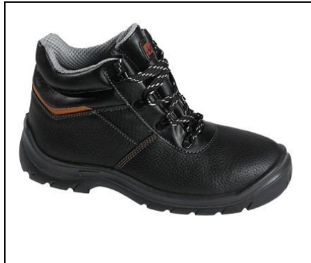
MTS Pilot S3 Modell 7104