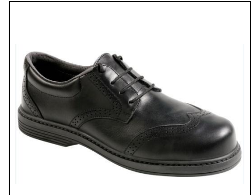
MTS London S3 Modell 19102