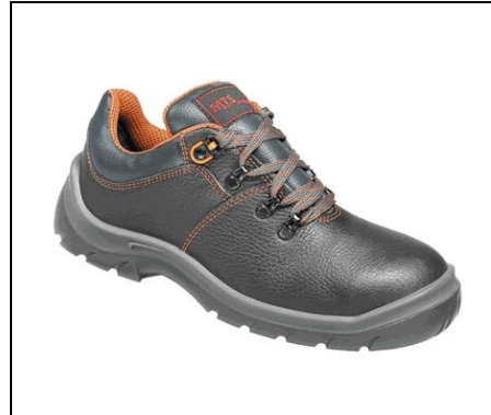
MTS Speed S3 Modell 7103