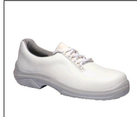
MTS Delphe S2 Modell 15208