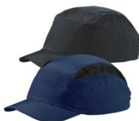
VOSS – Modell Cap modern style