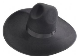
JOB Hut aus Wollfilz 2050/2051