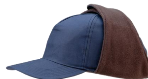
VOSS – Modell Cap winter